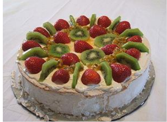
有名なニュージーランド料理の一つに、「パブロバ」というデザートがあります。

ニュージーランドは歴史が浅く、様々な文化が共存する国なので、実際のところ郷土料理や歴史ある食文化というものはありません。ニュージーランド料理はさまざまな文化の融合であり、まさにニュージーランド社会を象徴しています。