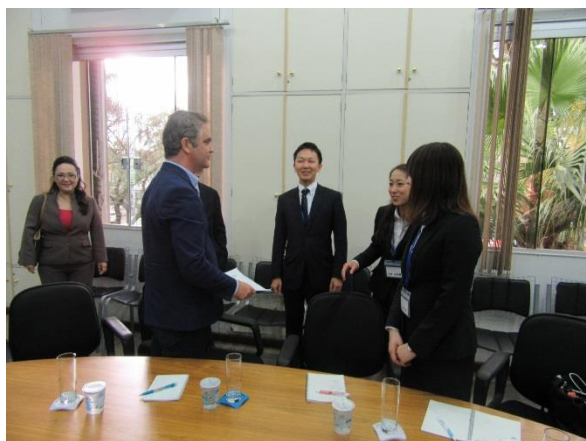
(昨年度マリンガ市長表敬訪問の様子)

次代を担う若者を本市の姉妹都市「ブラジル・マリンガ市」に派遣し、そこでの交流を通じて外国人への理解を深めて国際的視野を持ち、国際親善に貢献できる行動力のある国際人を育成することを目的とします。